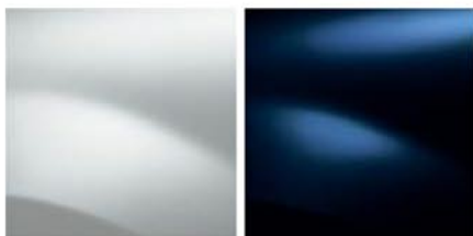
BRANCO GLACIAR (369)