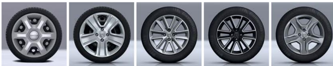
EMBELEZADORES DE RODA 15" ARACAJU