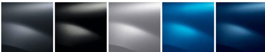
CINZENTO COMETA